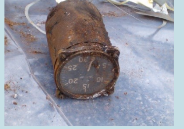
BUSSOLA CON QUADRANTE Radionuclide: Ra-226 Provenienza: Impianto termovalorizzatore