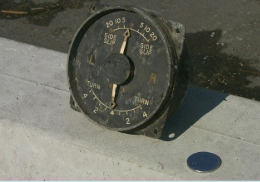
QUADRANTE Radionuclide: Ra-226 Provenienza: Rottami metallici in importazione