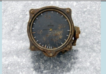
QUADRANTE Radionuclide: Ra-226 Provenienza: Rottami metallici (Confine di Stato)