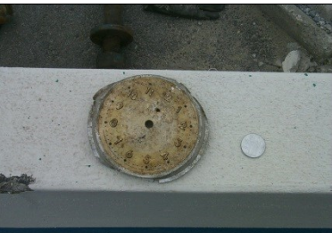
SVEGLIA (QUADRANTE) Radionuclide: Ra-226 Provenienza: Rottami metallici in importazione