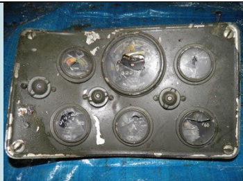
PANNELLO CON QUADRANTI Radionuclide: Ra-226 Provenienza: