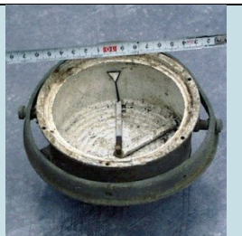
BUSSOLA (QUADRANTE) Radionuclide: Ra-226 Provenienza: