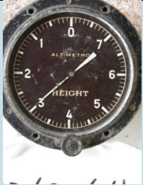
ALTIMETRO Radionuclide: Ra-226 Provenienza: Impianto termovalorizzatore