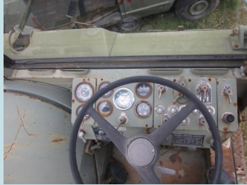
QUADRANTI DI VEICOLO MILITARE Radionuclide: Ra-226 Provenienza: