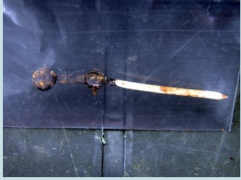
LANCETTA DI QUADRANTE Radionuclide: Ra-226 Provenienza: Rottami metallici (Confine di Stato)