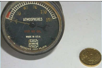
QUADRANTE Radionuclide: Ra-226 Provenienza: Rottami metallici in importazione