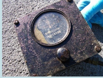
BUSSOLA CON QUADRANTE Radionuclide: Ra-226 Provenienza: Impianto termovalorizzatore