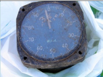
TACHIMETRO Radionuclide: Ra-226 Provenienza: Rottami metallici (Acciaieria)