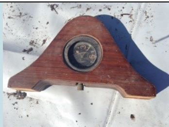
OROLOGIO Radionuclide: Ra-226 Provenienza: