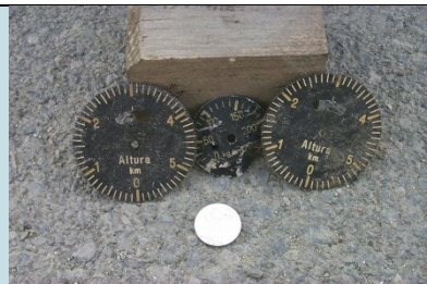
QUADRANTI Radionuclide: Ra-226 Provenienza: Rottami metallici in importazione