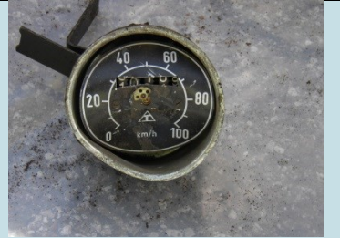
TACHIMETRO Radionuclide: Ra-226 Provenienza: Rottami metallici (Acciaieria)