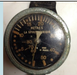
QUADRANTE Radionuclide: Ra-226 Provenienza: