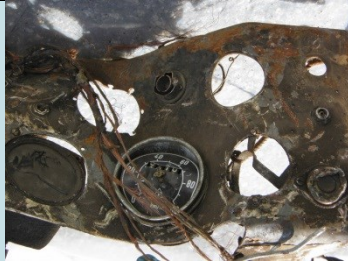
PLANCIA CON QUADRANTI Radionuclide: Ra-226 Provenienza: Rottami metallici (Acciaieria)