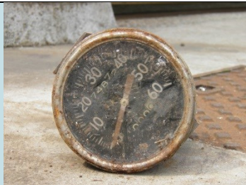
QUADRANTE Radionuclide: Ra-226 Provenienza: