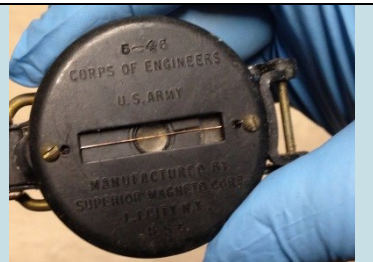
BUSSOLA Foto di: ARPA Toscana Radionuclide: Ra-226 Provenienza: