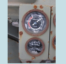
QUADRANTI DI VEICOLO MILITARE Radionuclide: Ra-226 Provenienza: