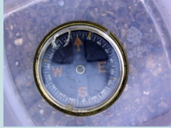
BUSSOLA Radionuclide: Ra-226 Provenienza: Privato