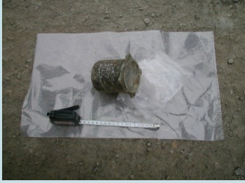
STRUMENTO CON QUADRANTE Radionuclide: Ra-226 Provenienza: