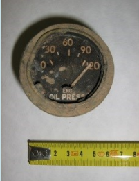
QUADRANTE DI MANOMETRO PER OLIO MOTORE (MACCHINA AGRICOLA) Radionuclide: Ra-226 Provenienza: Impianto raccolta rottami metallici