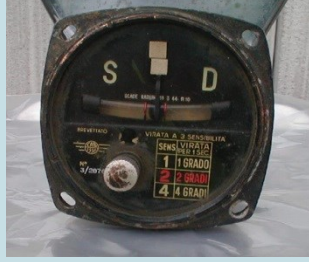
STRUMENTO CON QUADRANTE Radionuclide: Ra-226 Provenienza: