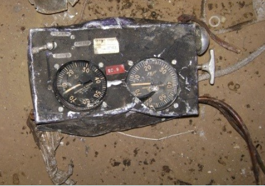
QUADRANTE Radionuclide: Ra-226 Provenienza: Fonderia