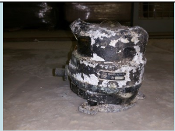
BUSSOLA (NAUTICA DA INCASSO) Radionuclide: Ra-226 Provenienza: