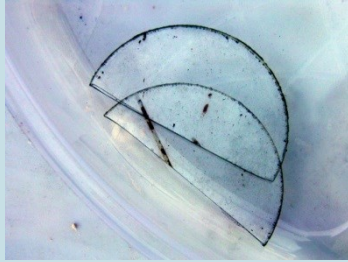
VETRI Radionuclide: Ra-226 Provenienza: Privato